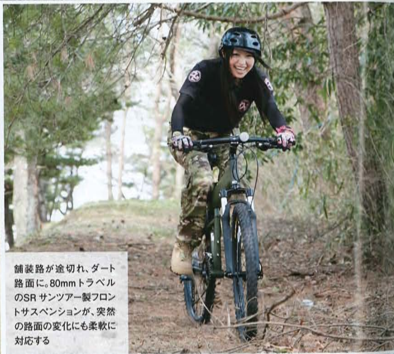
舗装路が途切れ、ダート路面に。80mmトラベルのSR サンツアー製フロントサスペンションが、突然の路面の変化にも柔軟に対応する