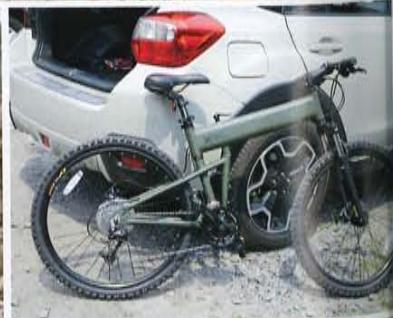
スタート地点に戻り、今回のサイクリングは終了。バラバイクで春を満喫できた