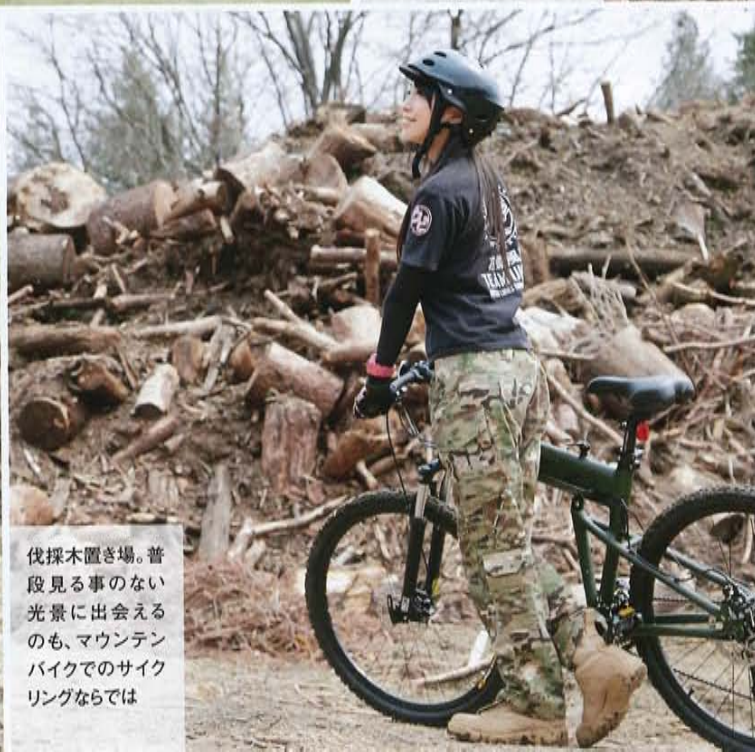
伐採木置き場。普段見る事のない光景に出会えるのも、マウンテンバイクでのサイクリングならではの