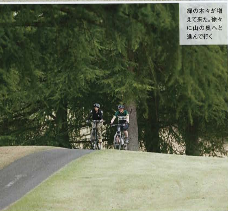
緑の木々が増えて来た。徐々に山の奥へと進んで行く