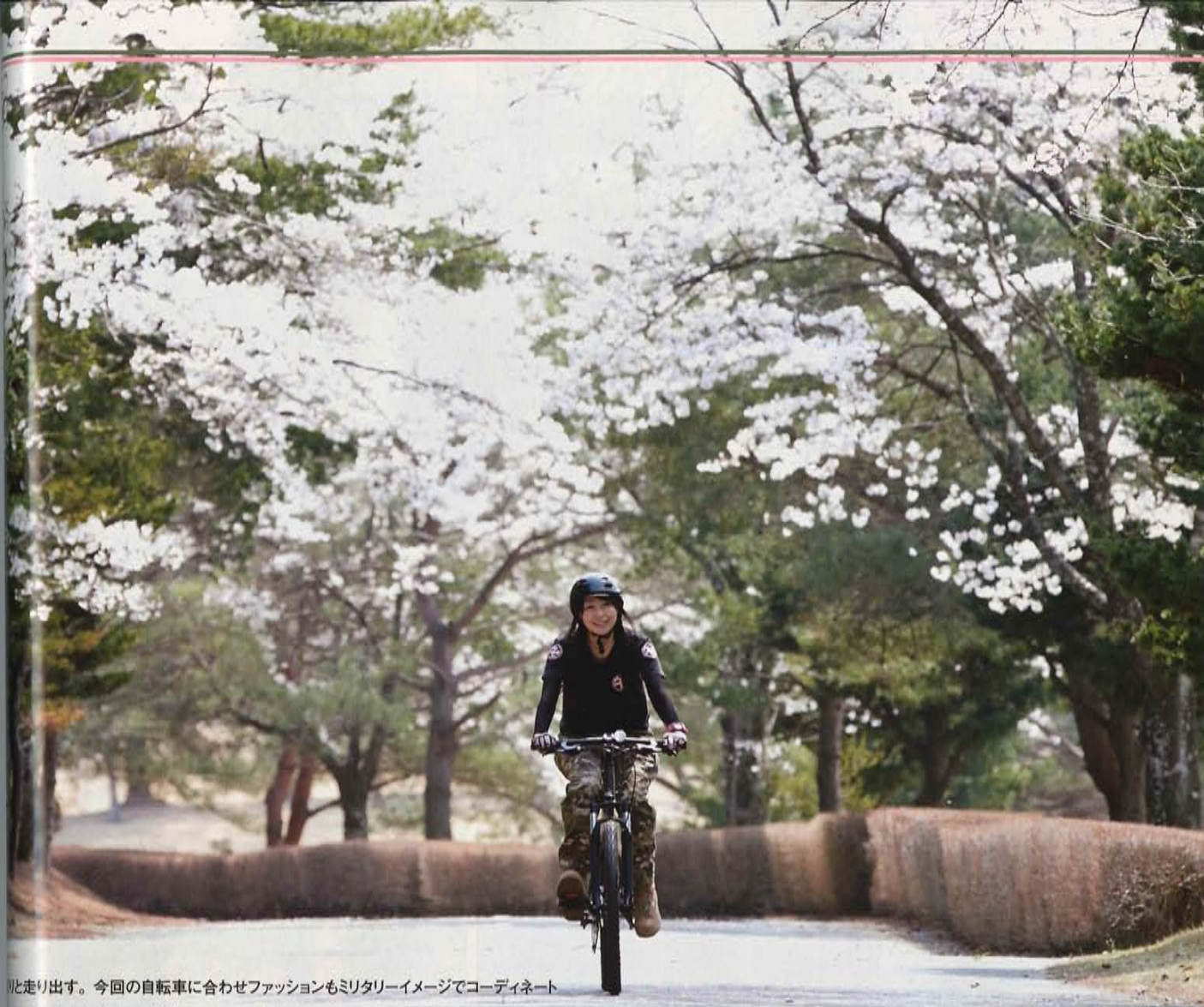
と走り出す。今回の自転車に合わせファッションもミリタリーイメージでコーディネート