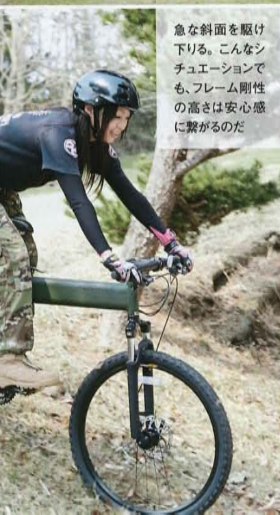
急な斜面を駆け下りる。こんなシチュエーションでも、フレーム剛性の高さは安心感に繋がるのだ